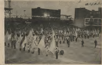
TAJPOE GENERAL DI N.A.T.O.

Y nan actuacion a worde den diferente ocasion aplaudido door di aficionadonan di futbol venezolano. Ta di speta cu tur anja e team campocin di nos division di futbol nan huntu lo creá e oportunidad di por sail pa e otro pais y cu yudanza como privilegio cu la pertenencia na un campocin. Awor nos ta haya pakiko AVB, no por busca un equipo di Venezuela,